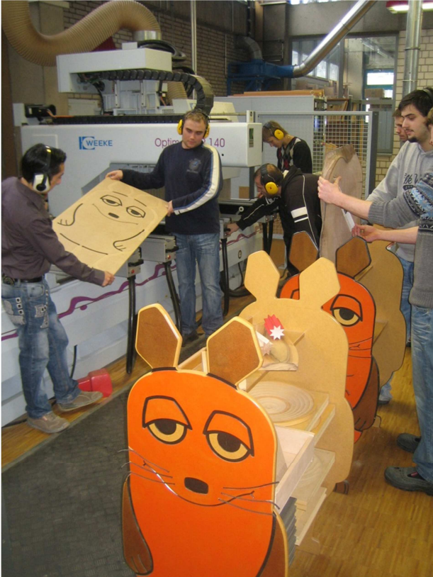
Einrichten des CNC - Bearbeitungszentrums